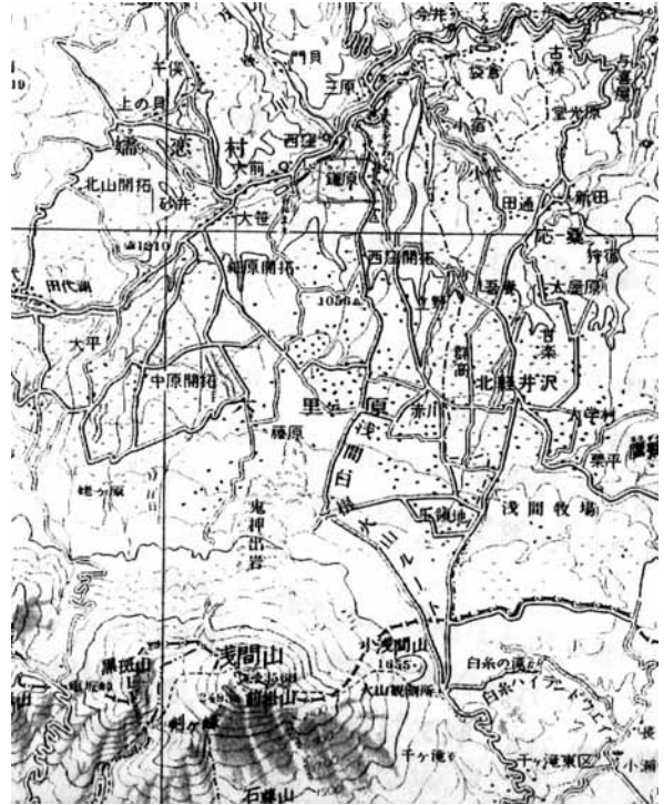
図1 浅間山麓の地形 国土地理院 20万分の1 地勢図「長野」

表1では死者が、466人となっているが、実際の犠牲者数は、現在鎌原観音堂の入口に33回忌のときに建てられた供養碑に刻まれている477人だったようだ。この相違は、災害時に受けた火傷やケガのためにしばらくしてから亡くなった人を