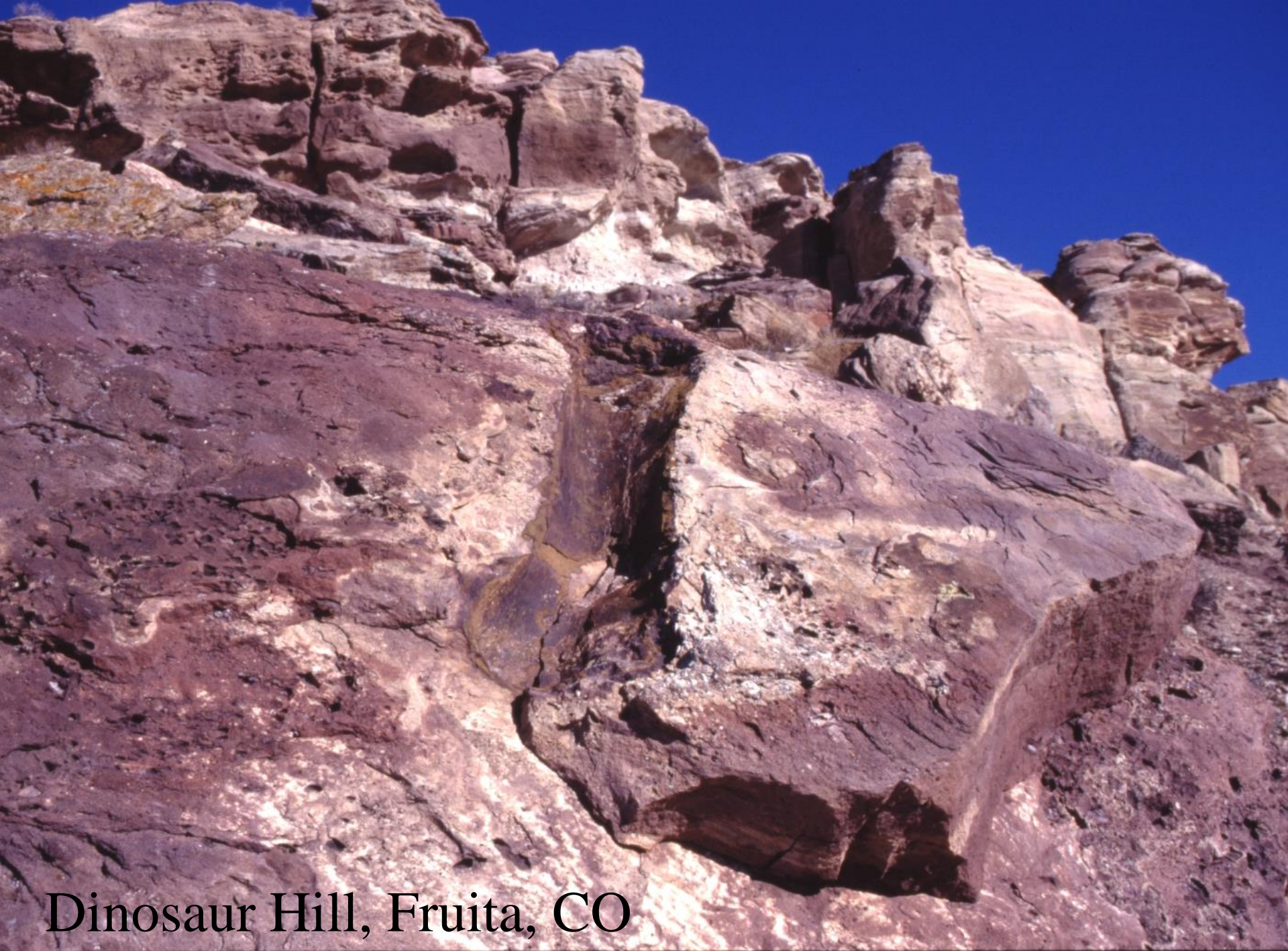
Dinosaur Hill, Fruita, CO